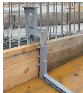
BE-FIX® PRONTO 25 cm mit Klemmwerkzeug